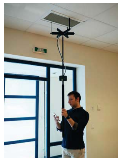
Utilizzo con griglia di misura