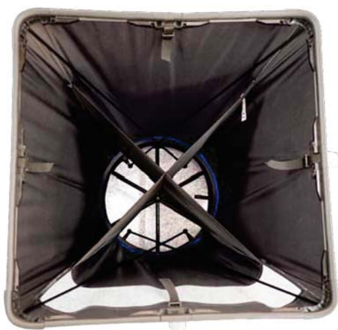
Effusore con raddrizzatore di flusso